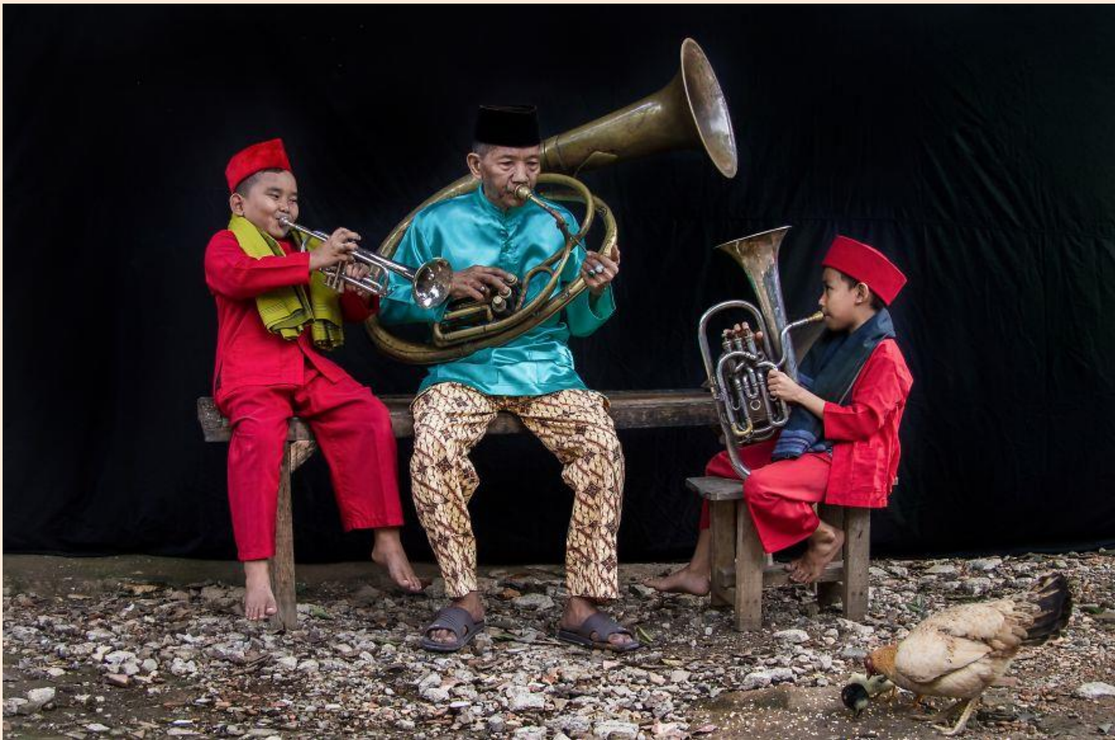
Aprenentatge d'instruments musicals/ Aprendizaje de instrumentos musicales

FOTO FINALISTA DELS PREMIS AGORA / FOTO FINALISTA DE LOS PREMIOS AGORA # EDUCATION 2019; DEDY DHAMIYANTO (INDONESIA)