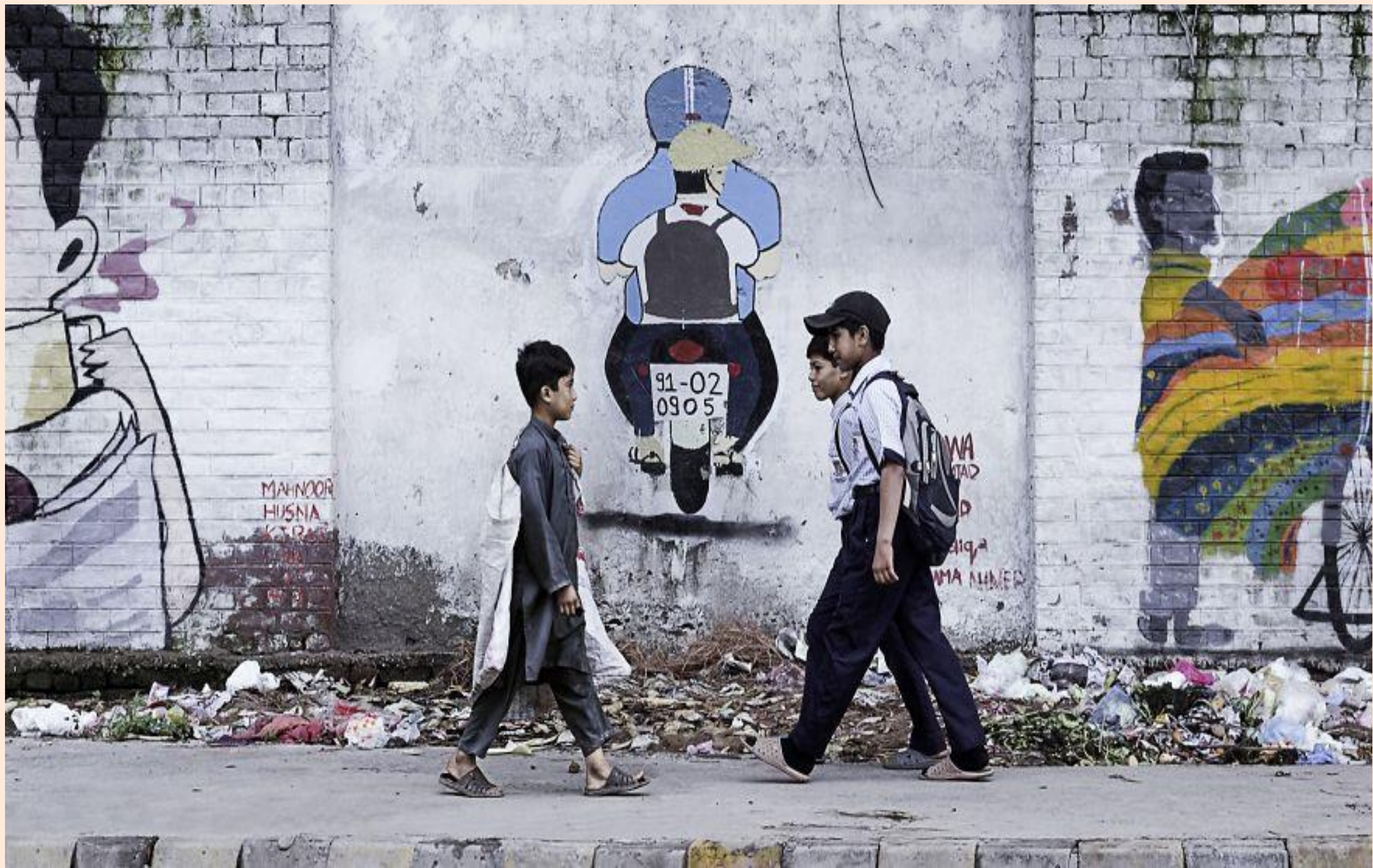
La diversitat d'un sistema educatiu desigual / La diversidad de un sistema educativo desigual

FOTO FINALISTA DELS PREMIS AGORA / FOTO FINALISTA DE LOS PREMIOS AGORA # EDUCATION 2019 : HASSAN MAJEED (PAKISTÁN)