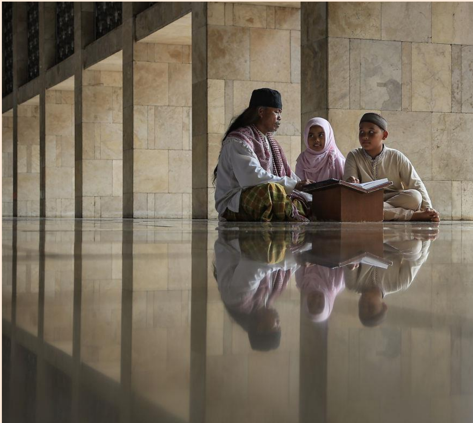
Llegint el Sagrat Alcorà / Leyendo el Sagrado Corán

FOTO FINALISTA DELS PREMIS AGORA / FOTO FINALISTA DE LOS PREMIOS AGORA # EDUCATION 2019 ; DANDI RAHMAN (INDONESIA)