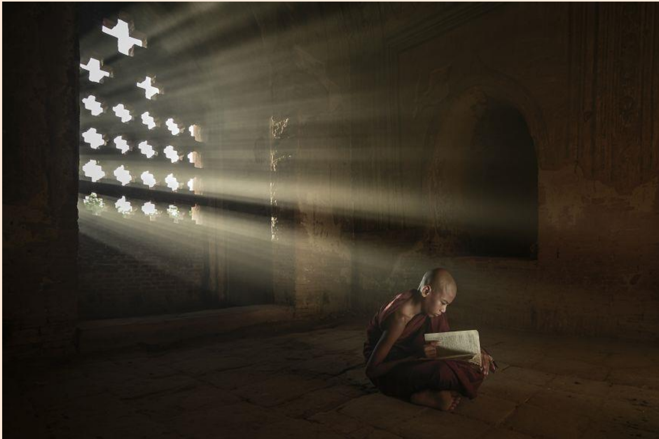
Temps d'estudi / Tiempo de estudio

FOTO FINALISTA DELS PREMIS AGORA / FOTO FINALISTA DE LOS PREMIOS AGORA # EDUCATION 2019 : KYAW KHAING (MYANMAR)