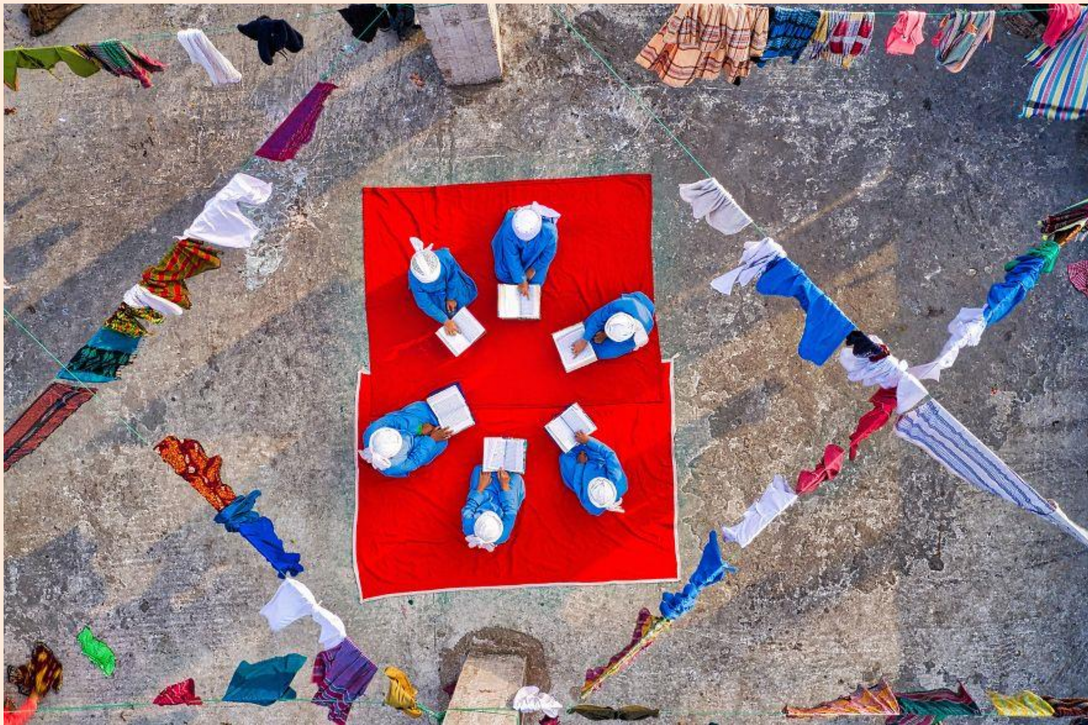
Recitant el Sagrat Alcorà / Recitando el Sagrado Corán

FOTO FINALISTA DELS PREMIS AGORA / FOTO FINALISTA DE LOS PREMIOS AGORA # EDUCATION 2019; AZIM KHAN RONNIE (BANGLADESH)