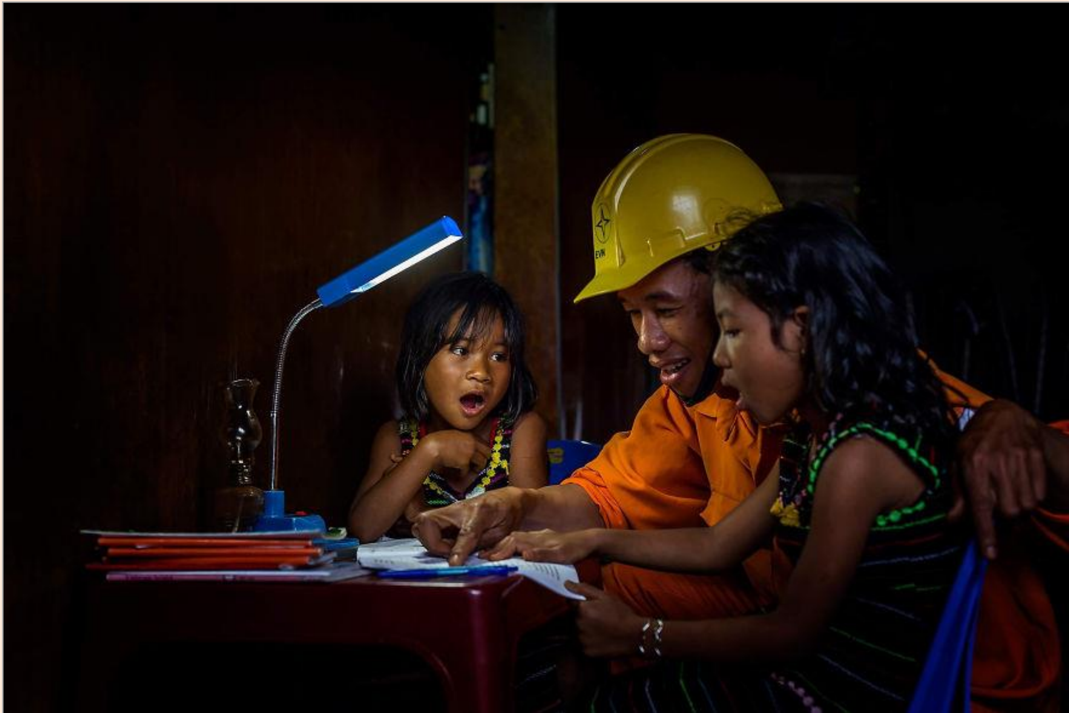
L'electricista està ensenyant a les xiquetes / El electricista está enseñando a las niñas

FOTO FINALISTA DELS PREMIS AGORA / FOTO FINALISTA DE LOS PREMIOS AGORA # EDUCATION 2019: ĐỖ TUẤN NGỌC (VIETNAM)