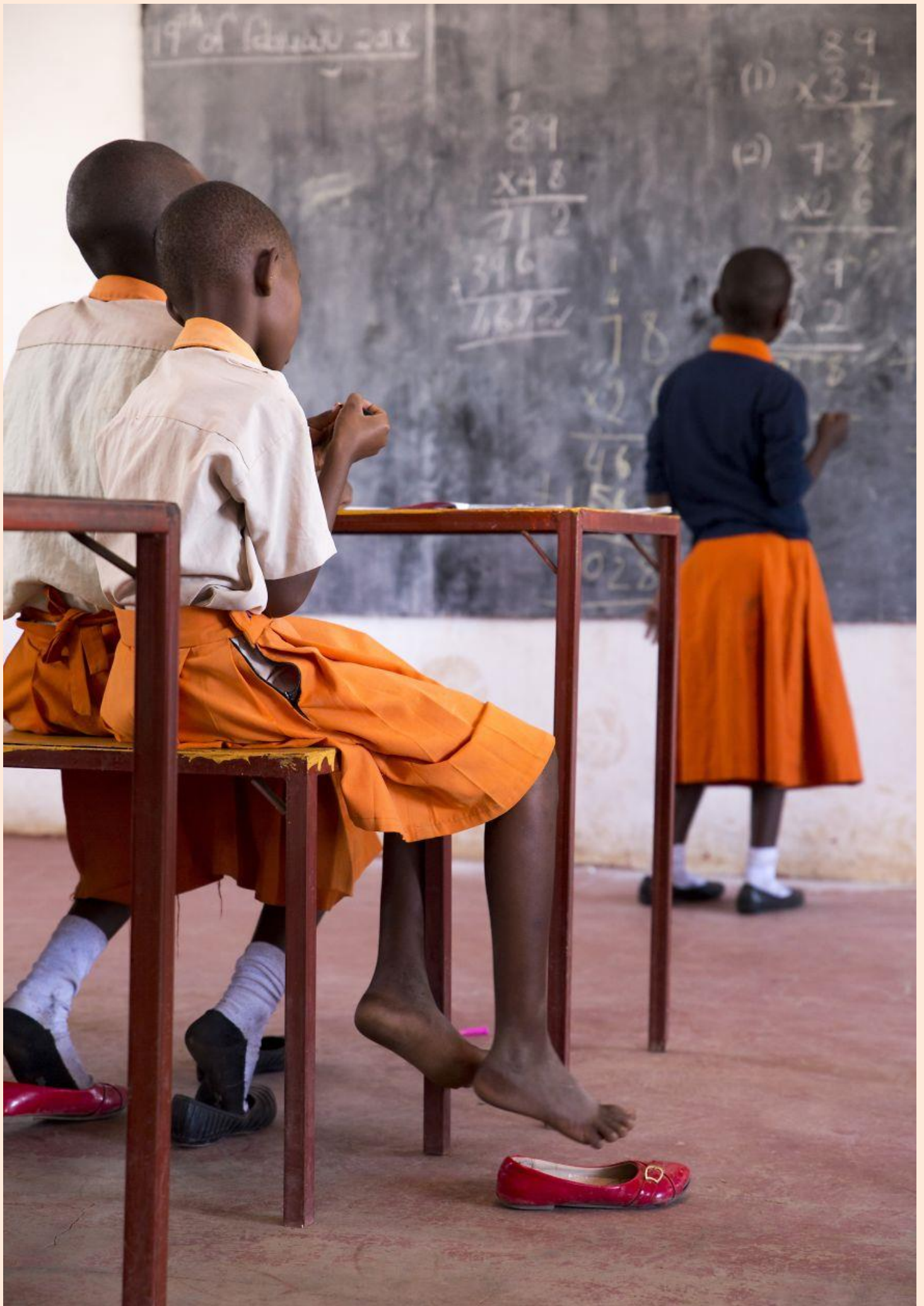
Escola en Tanzània/ Escuela en Tanzania

FOTO FINALISTA DELS PREMIS AGORA / FOTO FINALISTA DE LOS PREMIOS AGORA # EDUCATION 2019: RUTH HUNDESHAGEN (TANZANIA)