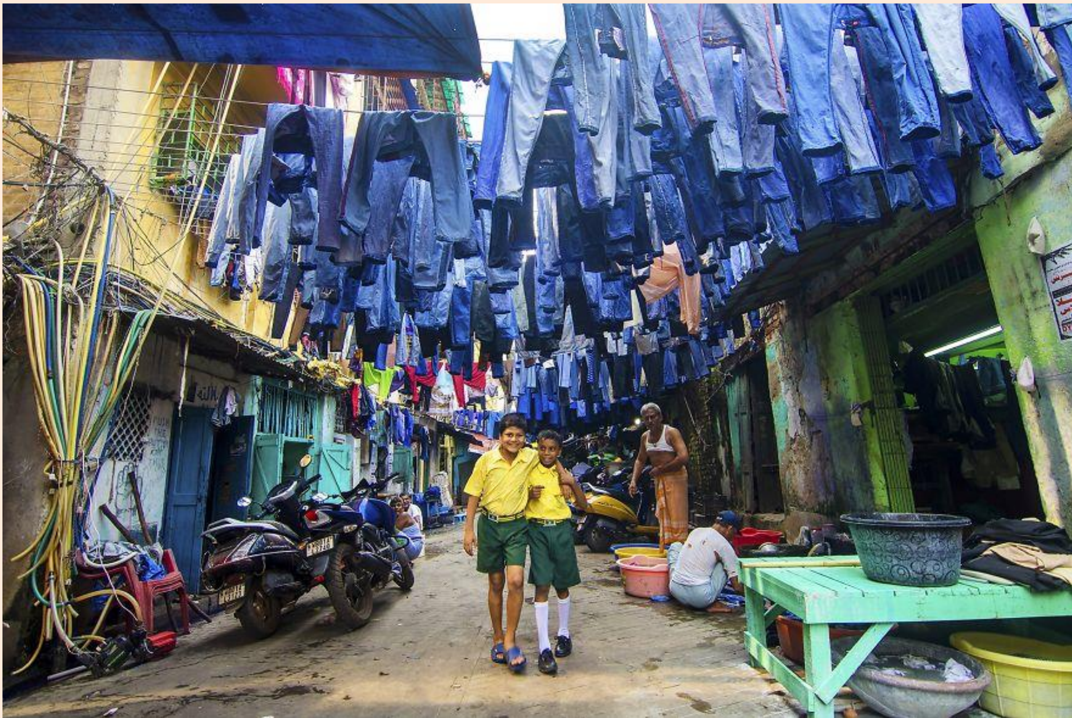
Estudiants de l'escola / Estudiantes de la escuela

FOTO FINALISTA DELS PREMIS AGORA / FOTO FINALISTA DE LOS PREMIOS AGORA # EDUCATION 2019 : SUJIT SAHA (INDIA)