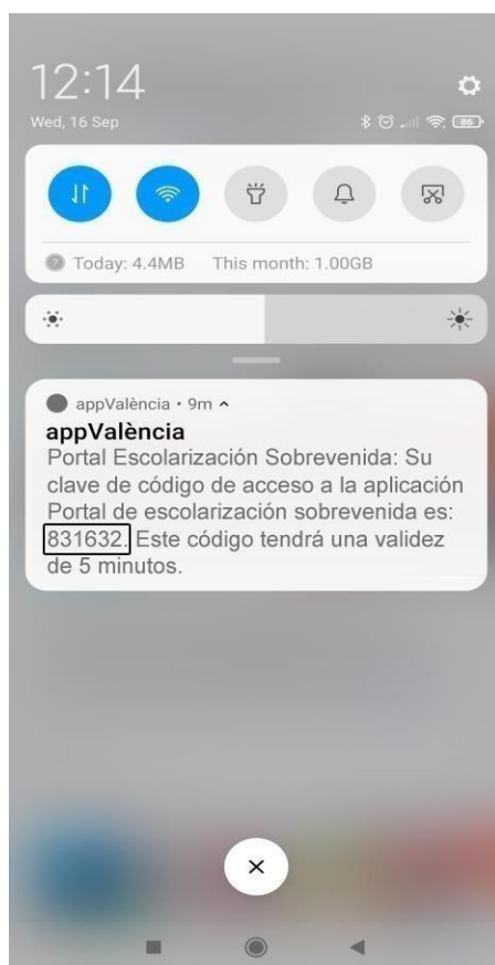
Pantalla de notificació i codi aleatori en el dispositiu mòbil

Pot fer lliscar la pantalla del seu mòbil per a veure la notificació enviada i anotar aquest codi aleatori d'accés a PortES.