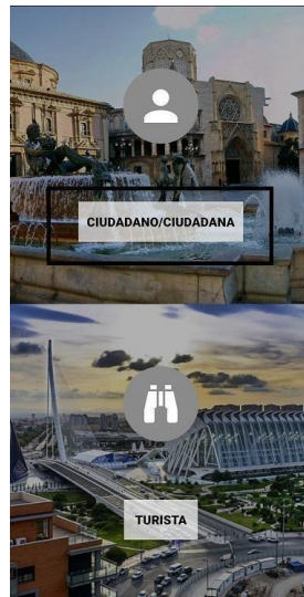
Selecció tipus d'usuari.

Una vegada oberta l'aplicació es mostrarà la pantalla de selecció d'usuari/a.