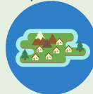
ACCIONS AMB L'ENTORN