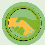
PRESENTACIÓ AL GRUP