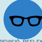
REVISIÓ, REFLEXIÓ I REFORÇ