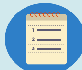
SEGUIMENT PER TAL D'AVALUAR L'ASSOLIMENT