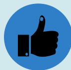
ACTITUDS POSITIVES VALENCIÀ