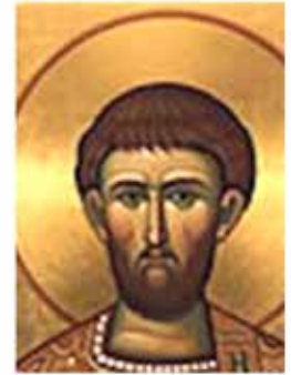
Palma de màrtir i graella.