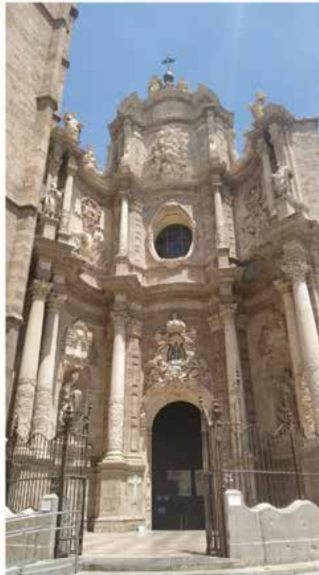
PORTA DELS FERROS