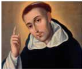
Dit índex apuntant al cel, llibres a la mà.