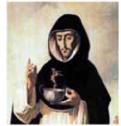
Copa d'or i canó de pistola convertit en crucifix.