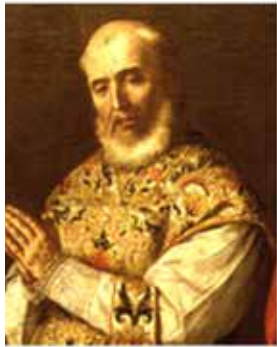
Vestit de canonge amb àngel oferint-li la mitra de Jaén.

4- La porta barroca de la Catedral de València està dedicada als sants i papes valencians. Identifica a cadascun i assenjala els dos patrons de la nostra ciutat Per què se'ls consideren els sants principals de València? Al costat de cada personatge et descrivim el seu representació perquè pugues investigar.